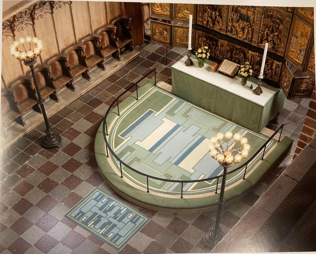
Udsmykning til alteret i Roskilde Domkirke: antependium, altertæppe, knæfald og brudetæppe.